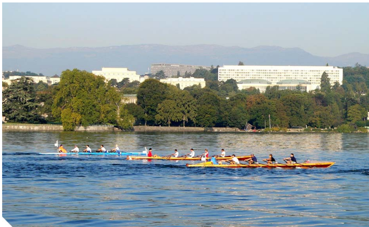
Les participants longeant l'ONU